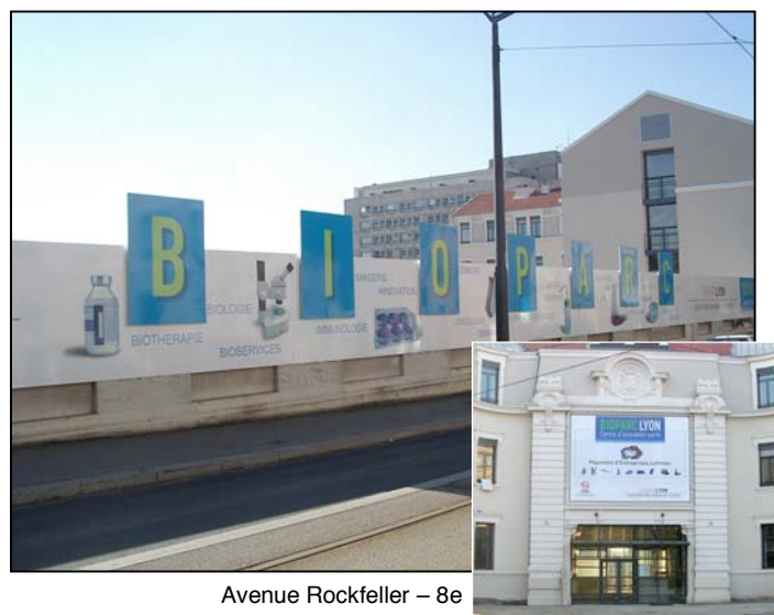
Avenue Rockfeller – 8e

Rôle de l'agence : Conception, rédaction, direction artistique, suivi des prises de vues, suivi de production.